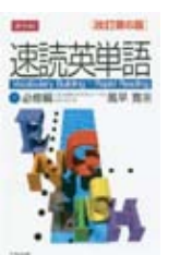
▲高校生の英語学習で使用される速読英単語とビンテージ授業内でも英語教材の使用法について話している。